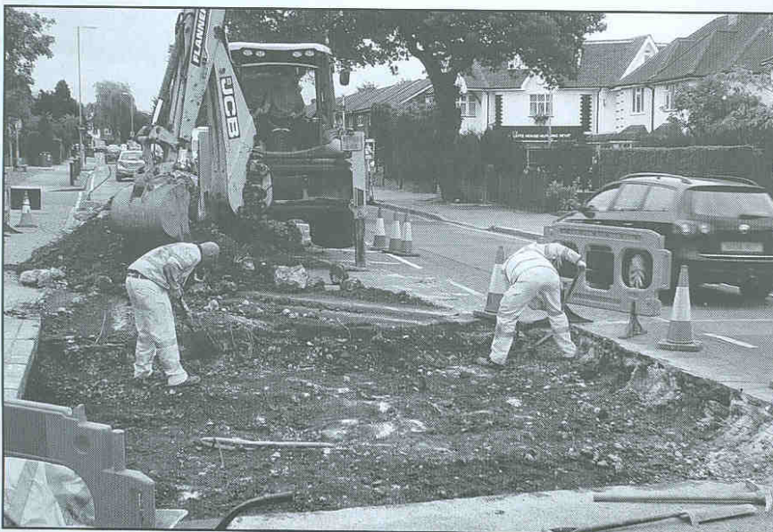
Сунчаница представља поремећај терморегулације која настаје као последица директног дејства сунчевих зрака на откривену главу